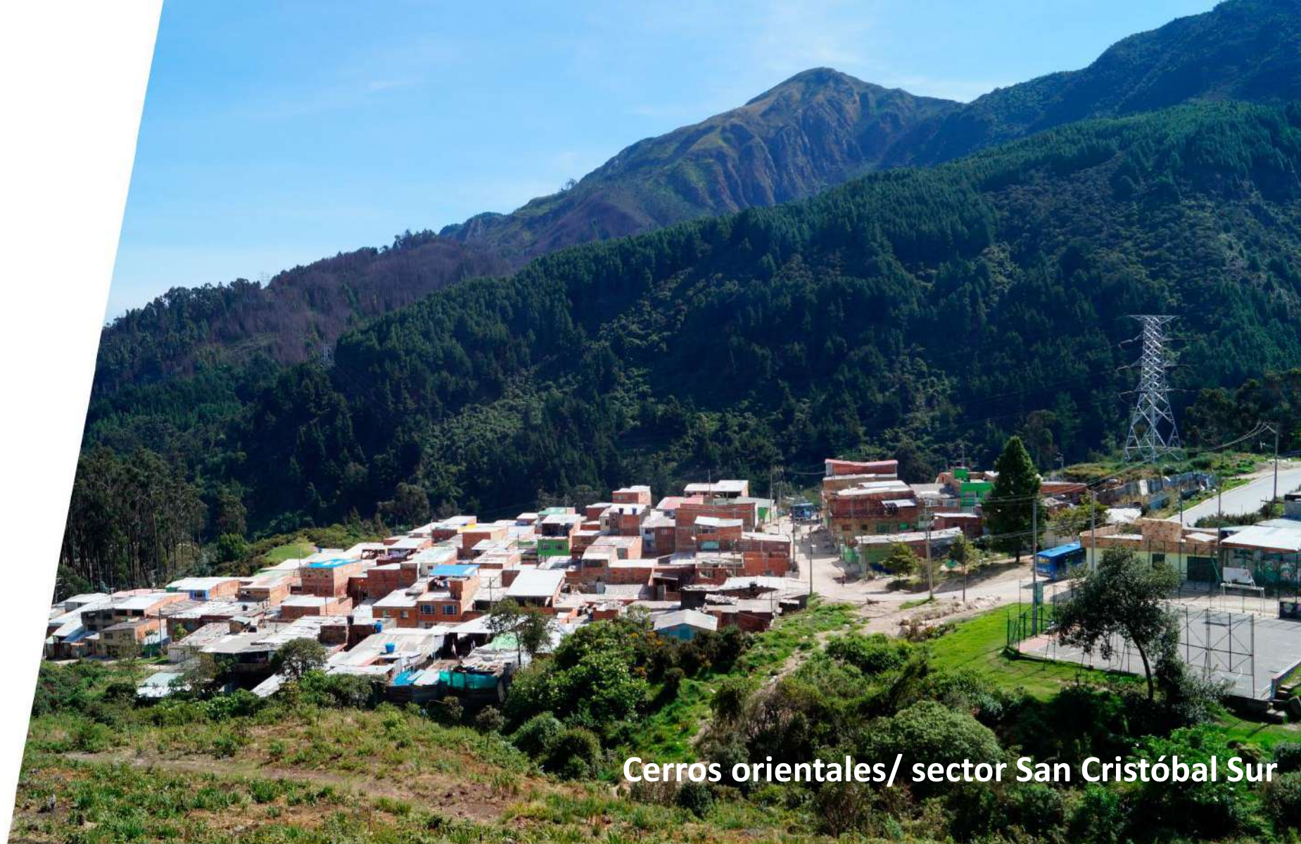
Cerros orientales/ sector San Cristóbal Sur

Cambiar nuestros hábitos de vida para reverdecer Bogotá y adaptarnos y mitigar la crisis climática